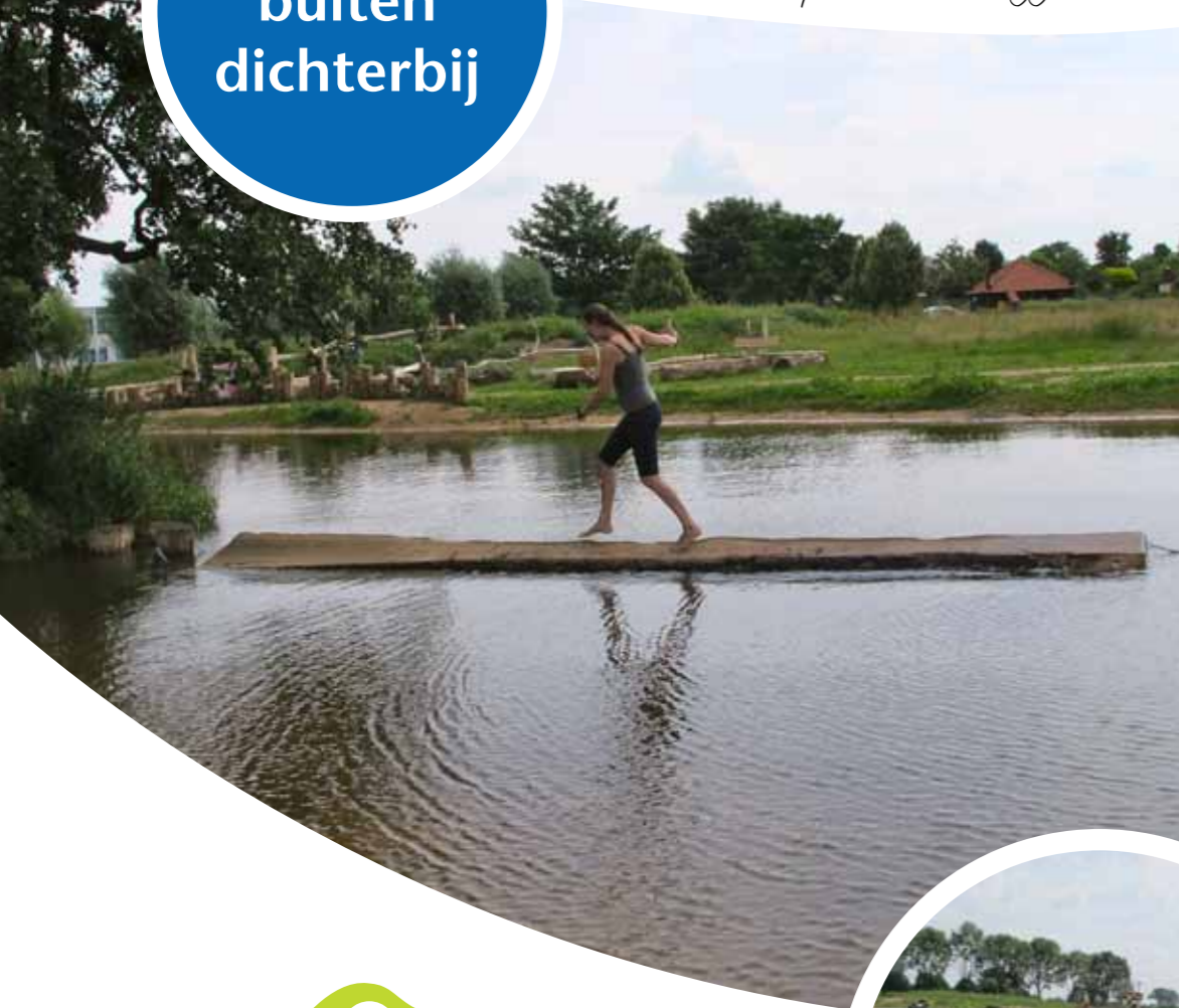
en spannende bruggen...